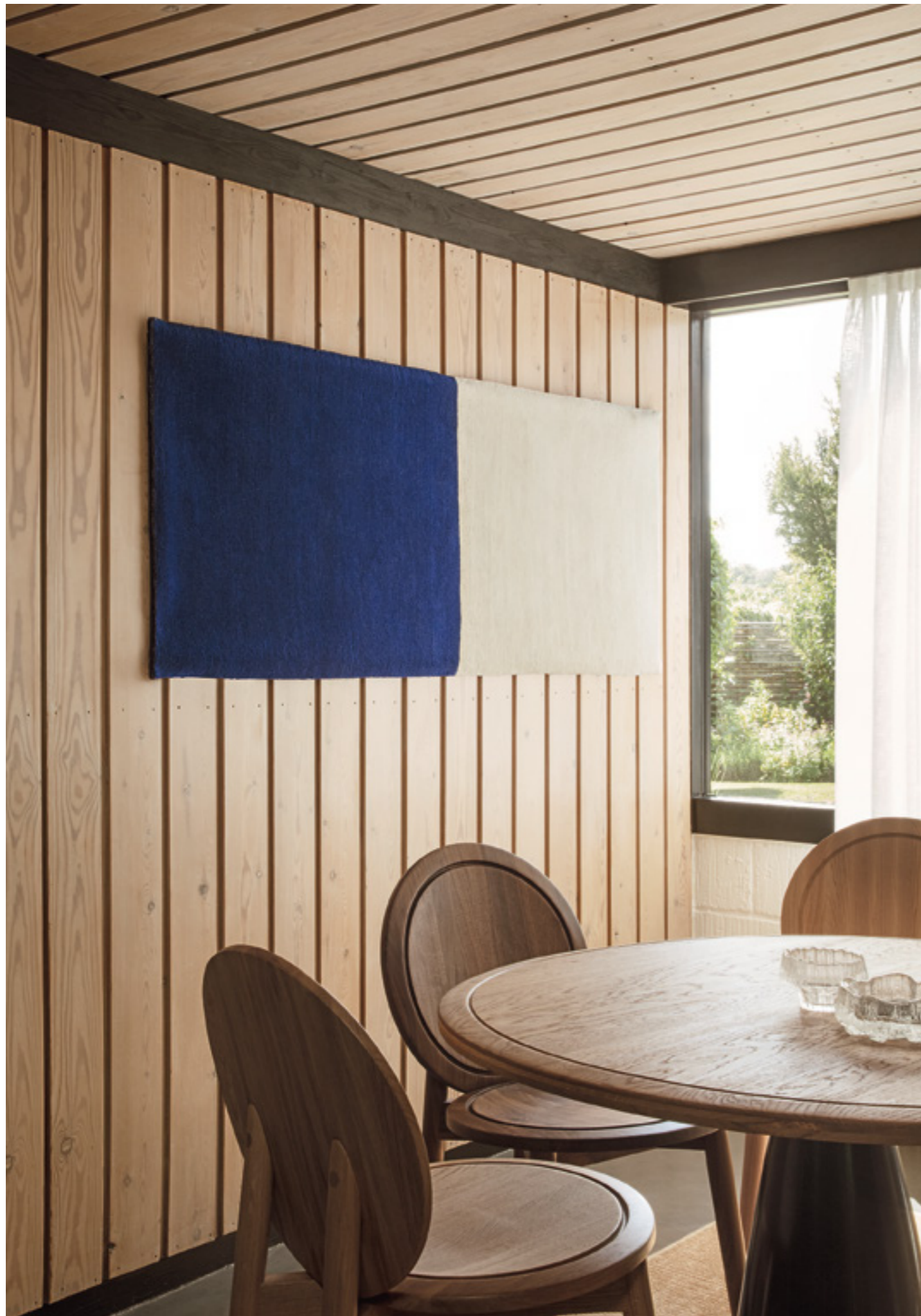
Page 24 / Margrethe Odgaard, Versus Edition.